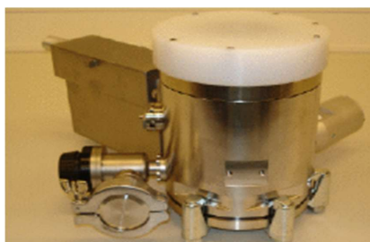
Imagem da Peça

Sistema: Parte do conjunto da coluna de elétrons, especificamente da seção canhão/módulo.